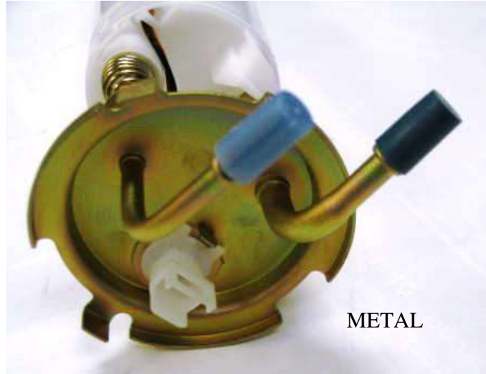
Figuras 2 y 3.

Los módulos DL70xxM tienen 2 tipos de configuración de la parte superior.